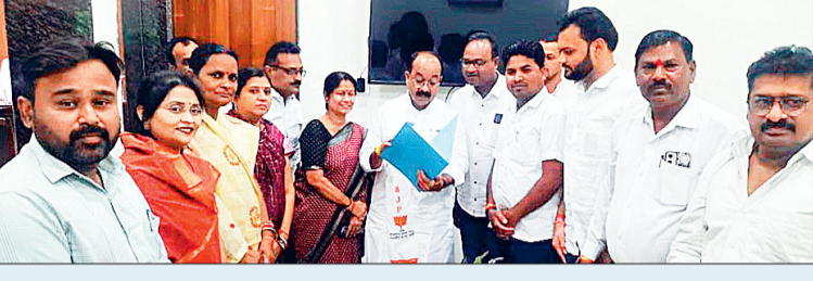
शहर के तालाबों का भी होगा सौंदर्यीकरण: राज्य प्रवर्तित योजना अंतर्गत तालाबों के विकास व सौंदर्यीकरण करने हरणबांधा तालाब, शक्ति नगर तालाब, कैलाश नगर तालाब,पोलसाय पारा तालाब, बोरसी शीतला तालाब, बधेरा डोगिया तालाब, पुरगांव तालाब, बाधा तालाब उरला सहित कागुलबोर्ड शीतला तालाब का सौंदर्यीकरण, स्वच्छ भारत मिशन अंतर्गत दो स्थानों पर शौचालय निर्माण कार्यों के लिए वार्ड 31 पटेल चौक के पास पिक टॉयलेट निर्माण के लिए राशि की मांग की है। वहीं वार्ड 30 इंदिरा मार्केट में आकांक्षीय शौचालय निर्माण कार्य भी शामिल है।

इन कार्यों के लिए मांगी गई राशि इंदिरा मार्केट में मल्टीलेवन पार्किंग प्रस्ताव तैयार कर विकास कार्यों की स्वीकृति की मांग सहित वार्ड 3 व 4 गया नगर, खेल मैदान का विकास व उन्नयन कार्य, वार्ड 18 जवाहर नगर खेल मैदान का विकास उन्नयन कार्य, वार्ड 53 महावीर खेल मैदान पोर्टिया एवं वार्ड 54 पोर्टिया दशहरा मैदान स्थित खेल मैदान का विकास उन्नयन कार्य के लिए प्रस्ताव तैयार कर विकास कार्यों की स्वीकृति की मांग की। वहीं जलकर्म विभाग के तहत पेयजल व्यवस्था करने 3 स्थानों पर पानी टंकी निर्माण कार्य, फिल्टर प्लांट में पम्प व पैगल कार्य, पाइप लाइन विस्तर, पानी टैंकर के अलावा नल कनेक्शन शिफ्टिंग कार्य भी शामिल हैं। साथ ही शहर के विभिन्न वार्डों में सड़क डमरूकरण डब्लूएमएन तथा पेज रिपेयर के 31 कार्यों अधीरसंरचना मद से स्वीकृति की मांग पत्र सौंपा गया।