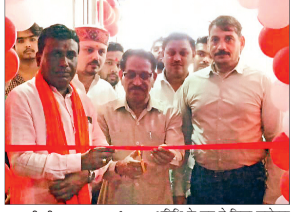
हरिभूमि न्यूज ▶▶कवर्धा