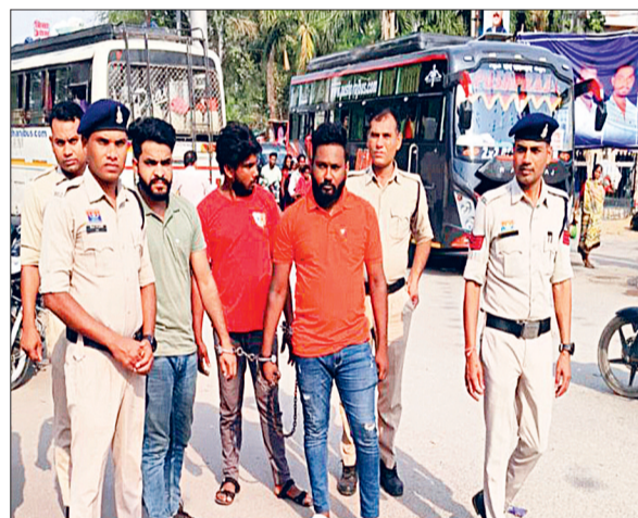
हरिभूमि न्यूज ▶▶कवर्धा

पुलिस प्रशासन की प्रभावी कार्यवाही, गाए जेल