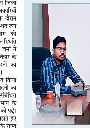
कलेक्टर ने निर्देशित किया कि सभी ग्राम पंचायतों, नगर पंचायतों एवं शहरी क्षेत्रों में पेयजल व्यवस्था सुनिश्चित की जाए तथा अधिकारी अलर्ट मोड में कार्य करें। उन्होंने कहा कि जिन गांवों या मोहल्लों में हैंडपंप या अन्य पेयजल स्रोत खराब हैं वहां सूचना मिलते ही तुरंत मरम्मत एवं सुधार कार्य प्रारंभ किया जाए। पेयजल संकट को हर हाल में टाला जाए। इसके लिए जनपद पंचायत के सीईओ, नगर पंचायत के सीएमओ, पीएचई विभाग के अधिकारी तथा तकनीकी अभियंताओं के बीच सम्बन्ध स्थापित कर त्वरित कार्यवाही सुनिश्चित करने के निर्देश दिए गए।